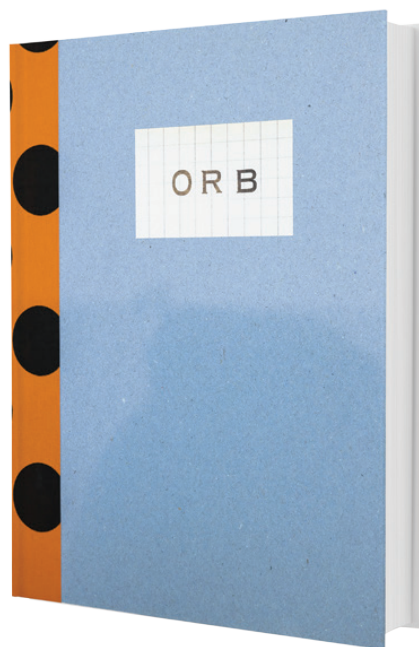
Alexandra y James Brown

artística del East Village expuso cada vez más en Europa, donde su trabajo fue visto en el contexto de postguerra en un modernismo europeo.